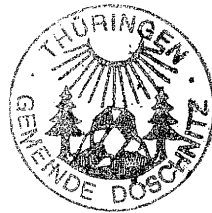
- Siegel -