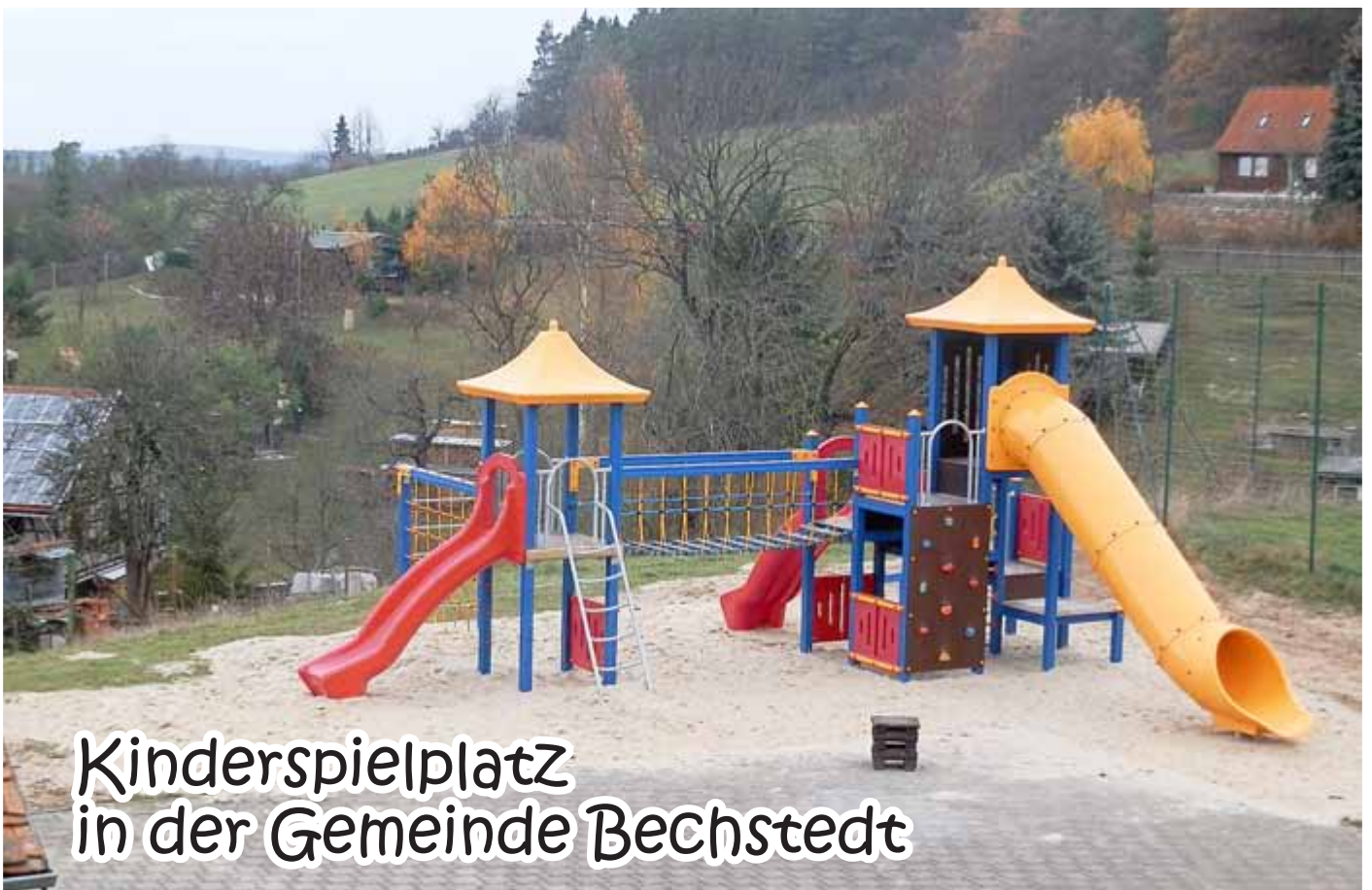
Kinderspielplatz in der Gemeinde Bechstedt